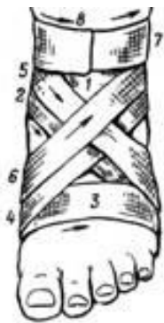
Рис. 3. Крестообразная (восьмиобразная) повязка на стопу

Крестообразная повязка на кисть. Закрывает тыльную и ладонную поверхности кисти, кроме пальцев, фиксирует лучезапястный сустав, ограничивая объем движений. Ширина бинта – 10 см.