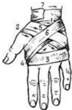
Рис. 4. Крестообразная (восьмиобразная) повязка на кисть

Бинтование начинают с закрепляющих круговых туров на предплечье. Затем бинт ведут по тылу кисти на ладонь, вокруг кисти к основанию второго пальца. Отсюда по тылу кисти бинт косо возвращают на предплечье. Для более надежного удержания перевязочного материала на кисти, крестообразные ходы дополняют круговыми ходами бинта на кисти. Завершают наложение повязки круговыми турами над запястьем.