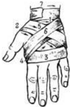
Рис. 4. Крестообразная (восьмиобразная) повязка на кисть

Бинтование начинают с закрепляющих круговых туров на предплечье. Затем бинт ведут по тылу кисти на ладонь, вокруг кисти к основанию второго пальца. Отсюда по тылу кисти бинт косо возвращают на предплечье. Для более надежного удержания перевязочного материала на кисти, крестообразные ходы дополняют круговыми ходами бинта на кисти. Завершают наложение повязки круговыми турами над запястьем.