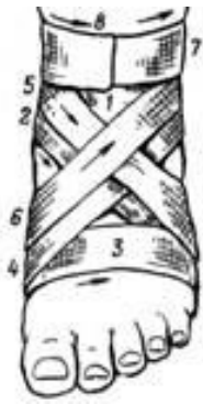
Рис. 3. Крестообразная (восьмиобразная) повязка на стопу

Крестообразная повязка на кисть. Закрывает тыльную и ладонную поверхности кисти, кроме пальцев, фиксирует лучезапястный сустав, ограничивая объем движений. Ширина бинта – 10 см.